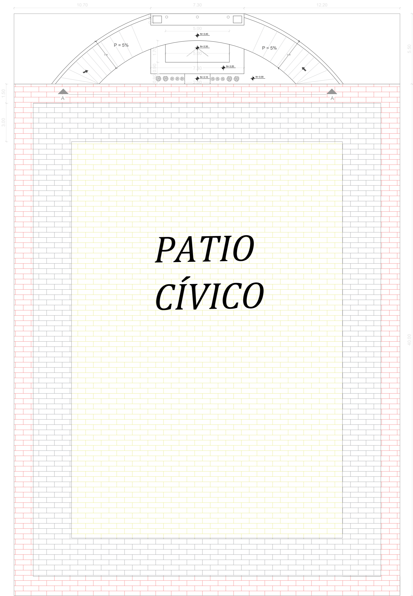
PLANTA BAJA ESCALA 1:100